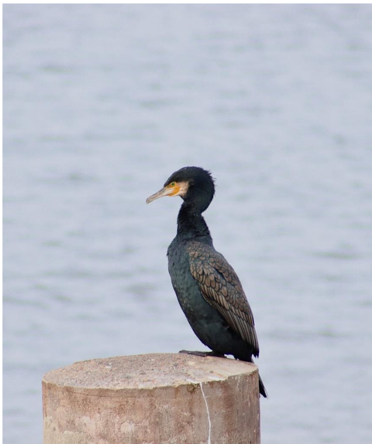
2: Skarv hviler sig på pæl.